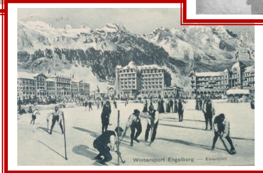
Wintersport Engelberg - Eiswägen