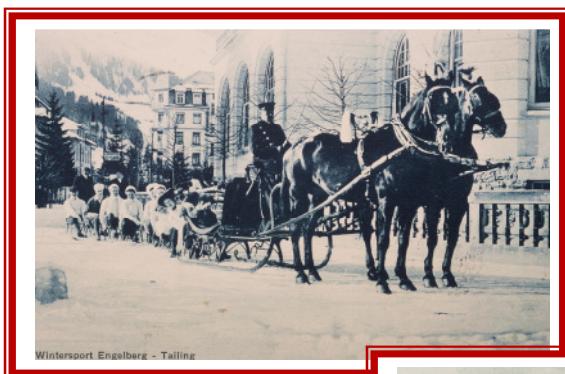
Wintersport Engelberg - Talling

Rösti serviert mit frischem Gemüse 18.50